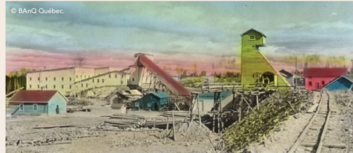
McWatters Gold Mines en 1936.

La paroisse Saint-Jean-l'Évangéliste a été fondée en 1941. À l'origine, McWatters était constituée de trois noyaux à la fois distincts et distants : McWatters, Farmborough et Joannès, ce qui explique en partie l'étalement de la population. Le cimetière de Farmborough demeure l'un des derniers vestiges des deux seules communautés protestantes à avoir existé à Rouyn-Noranda, celles de Farmborough et de Joannès.