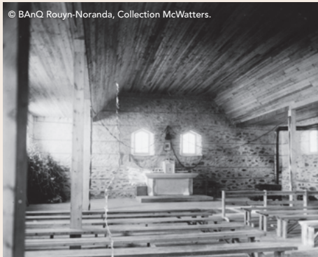
Vue intérieure de l'église.