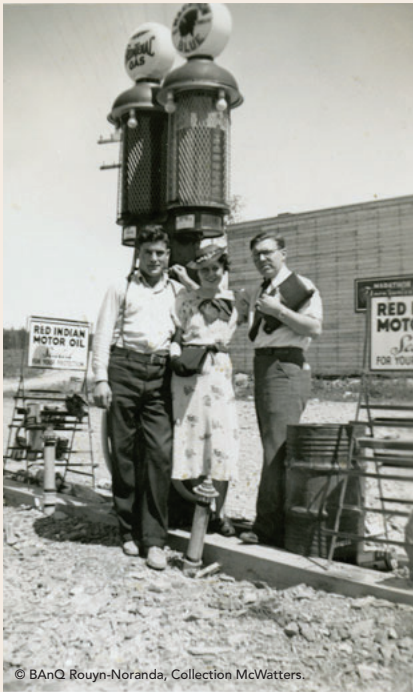
Clients à la station service.