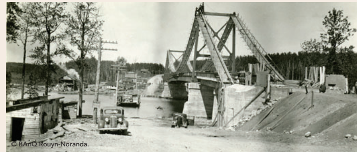
Construction du premier pont au-dessus de la rivière Kinojévis, facilitant le transport entre Rouyn-Noranda et le reste de la région.