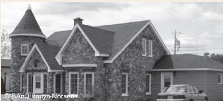
Le presbytère est de style architectural Queen Anne, caractérisé par sa tourelle latérale conique et ses pignons en saillie. Il a été construit par corvées en 1941.