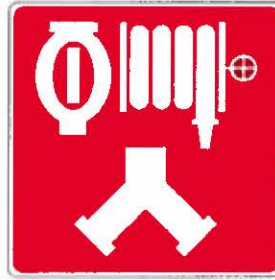
Raccord-pompier alimentant le système de gicleurs et les canalisations incendie (colonne montante)