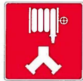
Raccord-pompier alimentant les canalisations incendie (colonne montante)