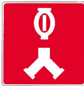
Raccord-pompier alimentant le système de gicleurs

ii) par l'ajout des logos suivants et de leur légende :